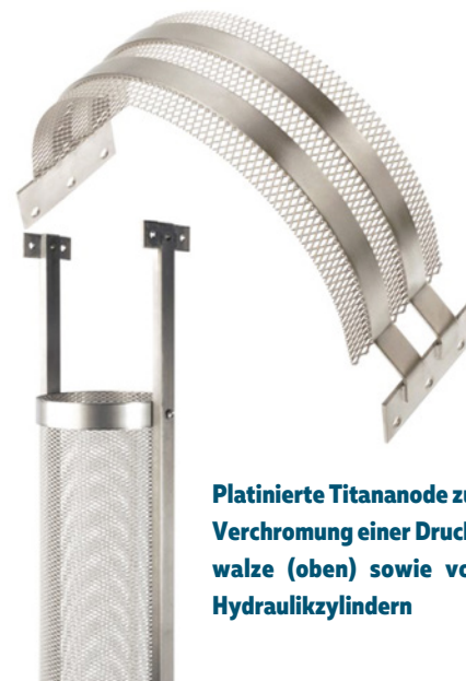
Platinierte Titananode zur Verchromung einer Druckwalze (oben) sowie von Hydraulikzylindern